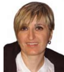
di Giorgia Grossi