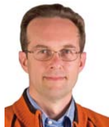
di Mauro Fabbri