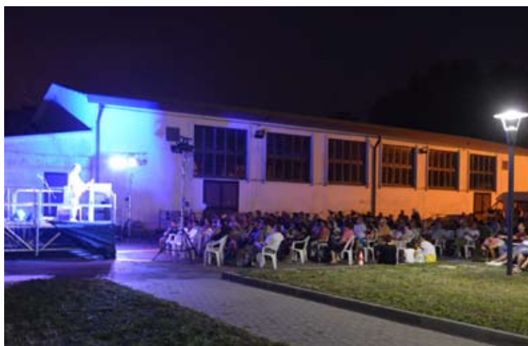
Dall'alto: Attività al Polo Artistico Culturale; Spettacolo a S. Antonio