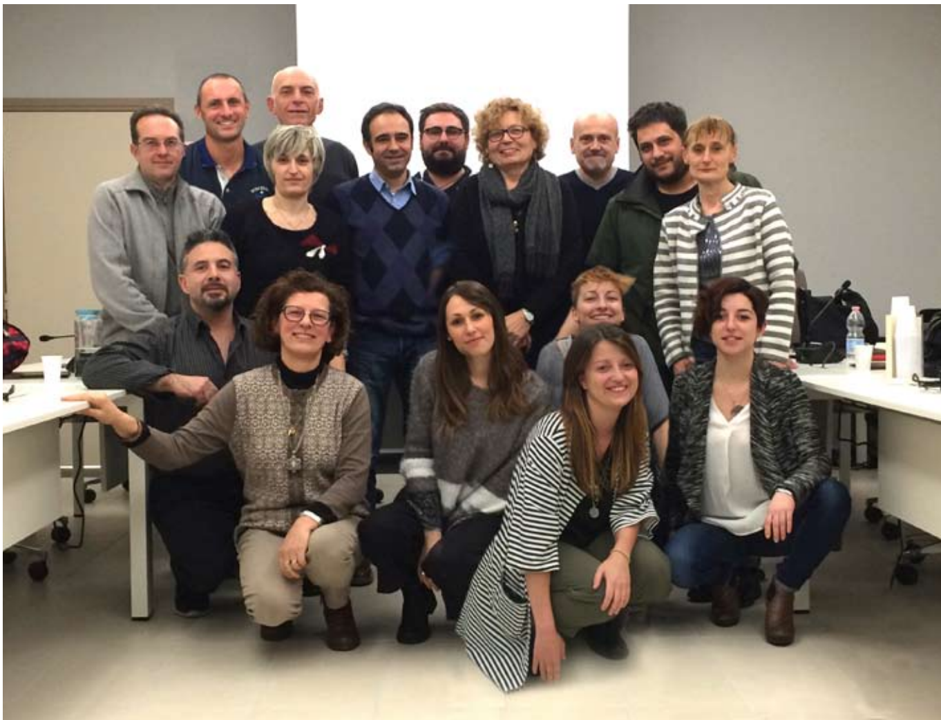
I componenti del Consiglio Comunale