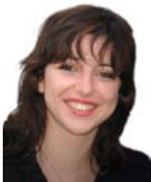
di Elena Cogato

E ra il lontano maggio del 2012 quando i cittadini di Novi diedero fiducia alla nostra lista civica. Eravamo giovani con molte idee ed energie, che vennero messe alla prova pochi giorni dopo quando il nostro territorio venne colpito dal sisma.